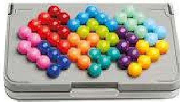
Gambar 5 Puzzle dengan konfigurasi non persegi panjang

Tugas Anda adalah untuk mengimplementasikan algoritma yang dapat menyelesaikan puzzle dengan konfigurasi custom pada input. Akibatnya, format input akan sedikit berbeda dari biasanya. Variabel N dan M pada input akan melambangkan dimensi papan yang bisa memuat konfigurasi. Lalu pada baris ketiga, akan diberikan sebuah matriks NxM yang terdiri atas titik dan X yang akan merepresentasikan konfigurasi custom . Pada matriks ini, character X melambangkan bagian pada papan yang perlu diisi untuk membentuk konfigurasi custom . Agar lebih jelas, diberikan contoh input dan output berikut.