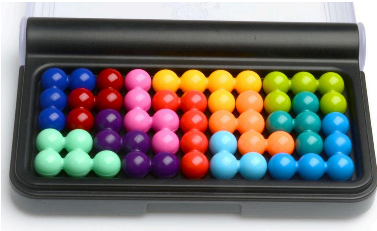
Gambar 1 Permainan IQ Puzzler Pro

IQ Puzzler Pro adalah permainan papan yang diproduksi oleh perusahaan Smart Games. Tujuan dari permainan ini adalah pemain harus dapat mengisi seluruh papan dengan piece (blok puzzle) yang telah tersedia.