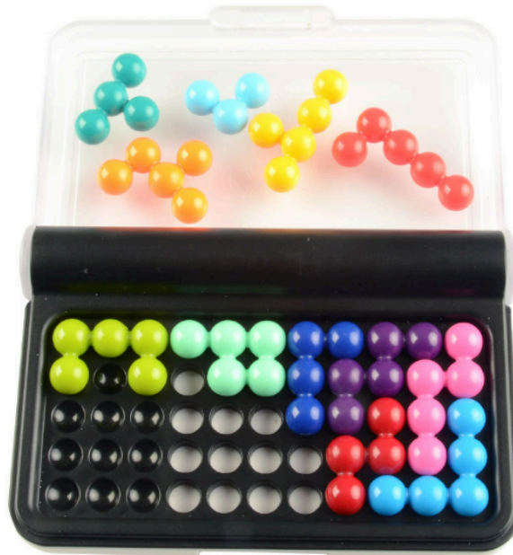
Gambar 2 Awal Permainan Game IQ Puzzler Pro

Diberikan sebuah wadah berukuran 11 x 5 serta 12 buah blok puzzle dan beberapa blok telah ditempatkan dengan bentuk sebagai berikut