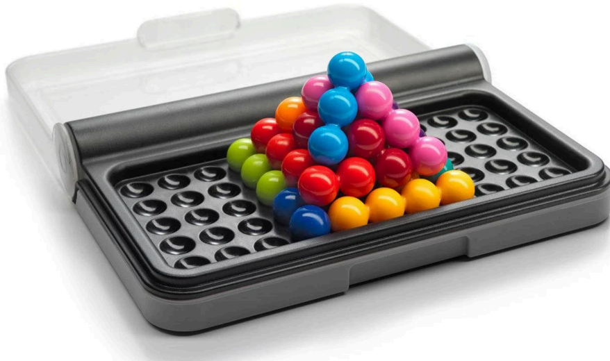
Gambar 6 Puzzle dengan konfigurasi piramida

IQ Puzzler Pro juga memiliki puzzle yang berbentuk tiga dimensi. Berbeda dengan puzzle biasanya dimana kita menyusun blok tanpa tumpang tindih, disini kita justru perlu menumpuk puzzle agar membentuk suatu konfigurasi 3D. Pada kasus ini, Anda harus membentuk konfigurasi piramida dengan alas persegi. Perhatikan bahwa pada konfigurasi ini blok puzzle bisa saja disusun dengan rotasi yang tidak umum pada kasus 2 dimensi.