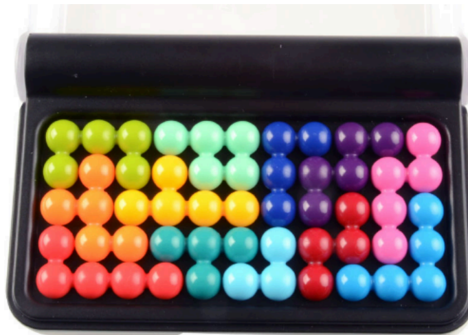
Gambar 4 Pemain Menyelesaikan Permainan

Permainan dinyatakan selesai jika pemain mampu mengisi seluruh papan dengan blok (dalam tugas kecil ini ada kemungkinan pemain tidak dapat mengisi seluruh papan)