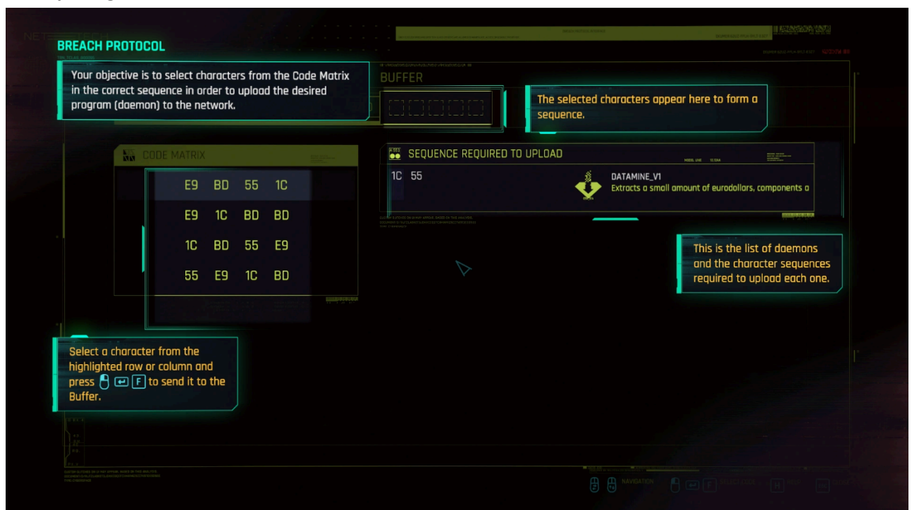
Gambar 1 Permainan Breach Protocol