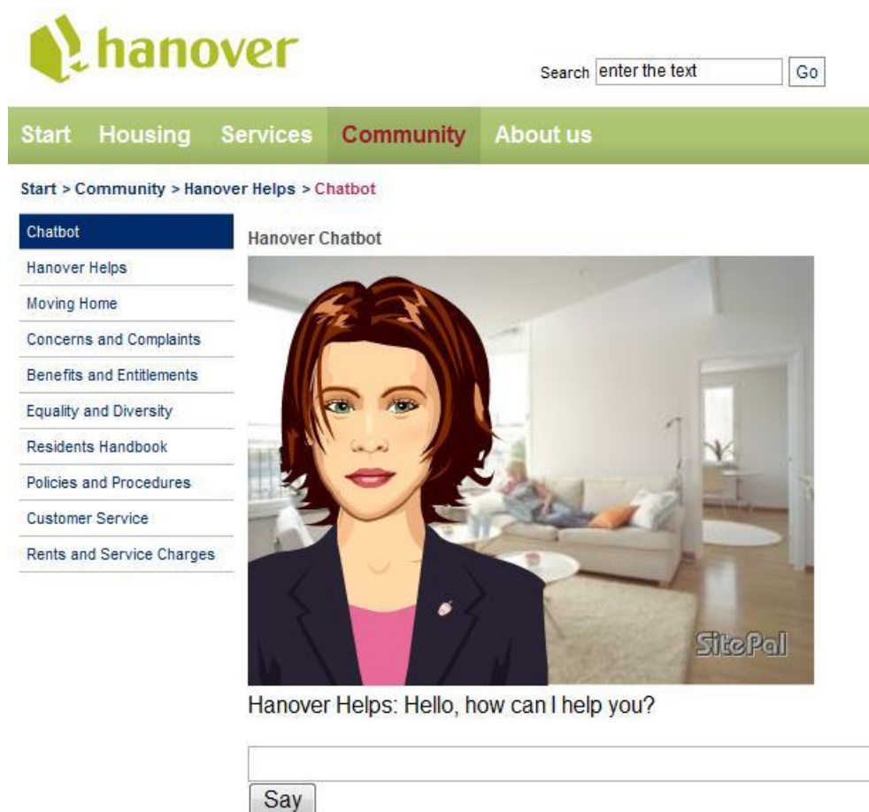
Gambar 1: Contoh sebuah antaramuka Chatbot daring

Chatbot atau chatterbot merupakan agen cerdas yang meniru kemampuan manusia untuk melakukan percakapan dengan pengguna manusia. Pembangunan chatbot dapat dilakukan dengan menggunakan berbagai pendekatan dari bidang Question Answering (QA) . Pendekatan QA yang paling sederhana adalah menyimpan sejumlah pasangan pertanyaan dan jawaban, menentukan pertanyaan yang paling mirip dengan pertanyaan yang diberikan pengguna, dan memberikan jawabannya kepada pengguna.