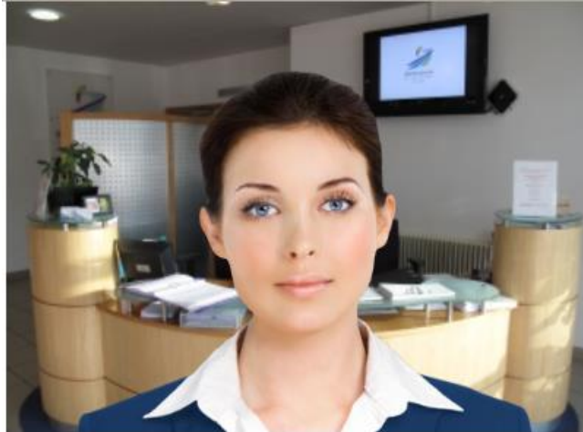
Gambar 2: Contoh dialog otomatis dengan Abi - Daden's Virtual Receptionist