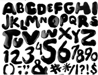
Gambar 1 Alfabet latin yang kita kenal 2

Istilah alphabet sebetulnya berasal dari bahasa Semit. Istilah ini terdiri dari dua kata, yaitu aleph yang berarti 'lembu jantan' dan kata beth yang berarti 'rumah'. Konotasi pictografis dari pengertian kedua kata ini menjadi sebutan untuk menunjukkan huruf pertama a ( aleph ) dan b ( beth ) dalam urutan huruf-huruf semit (Mario Pei, 1971:176).