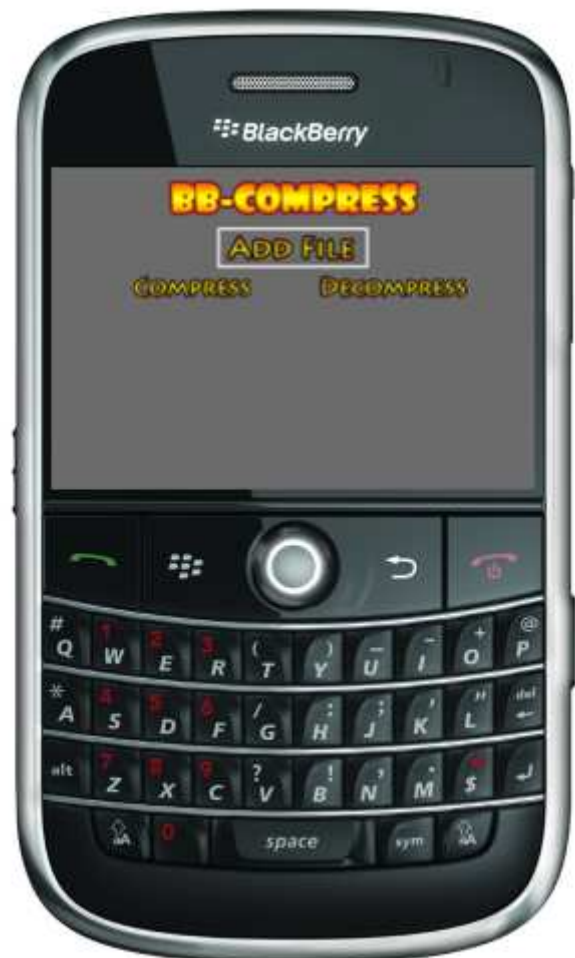
Gambar 1 Antarmuka utama aplikasi BB-Compress

Implementasi antarmuka agak berbeda dari perancangan antarmuka karena terjadi beberapa penambahan fitur seperti kompresi terhadap banyak file sekaligus dan penambahan progress bar. Antarmuka program adalah sebagai berikut :