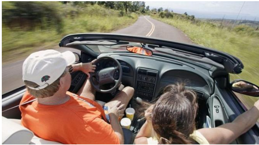
Setir mobil di Amerika