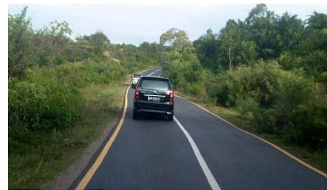
Mobil berjalan di jalur kiri di Indonesia