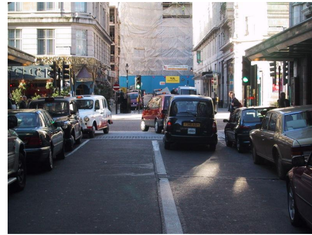
Mobil berjalan di jalur kanan di AS