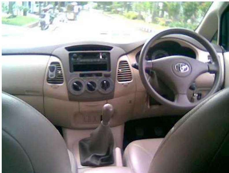
Setir mobil di Inggris/Indonesia