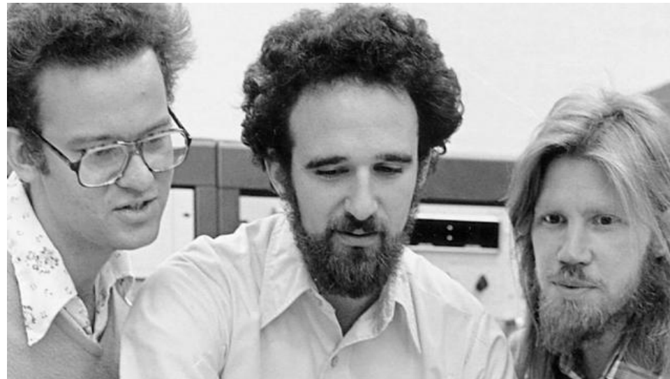
Merkle, Hellman, dan Diffie