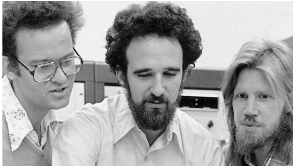
Merkle, Hellman, dan Diffie