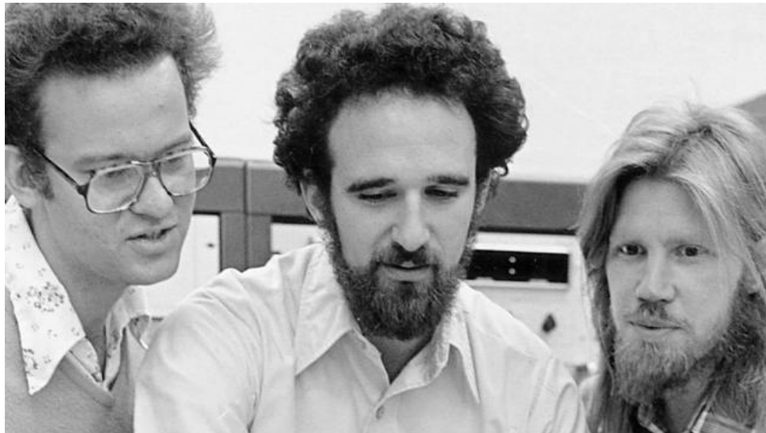
Merkle, Hellman, dan Diffie